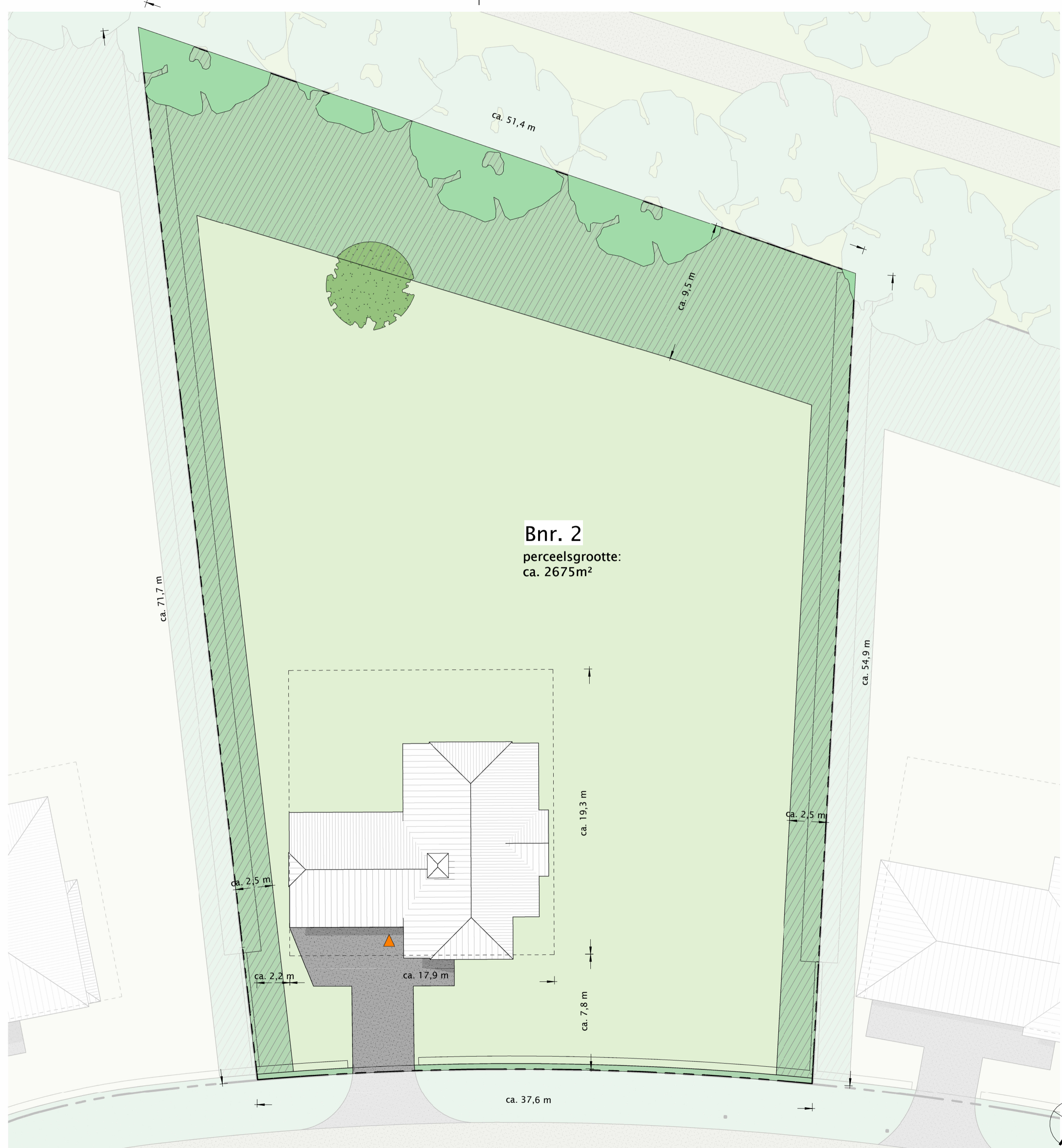
kavel bouwnummer 2 1 : 200